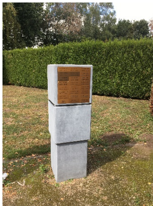
Voorbeeld van gedenkpaal

Genoemd is als nieuwe vorm van gedenken het plaatsen van een fysiek element (bijvoorbeeld een gedenkpaal waarop de naam van de dierbare is aangebracht), het natuurlijk begraven en het rekening houden met de diversiteit van onze inwoners.